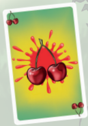
Príklad karty prezretého ovocia