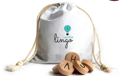
1 Bolsa y letras del alfabeto

¿Quieres poner tus neuronas a trabajar, desarrollar la imaginación, expandir tu vocabulario y atar cabos para cumplir tus objetivos? Bienvenid@ a Lingolandia. El juego está diseñado de dos a ocho jugadores, para todas las edades, que busquen algo más de un juego. Basados en la competición sana, los jugadores mejorarán su ortografía y el conocimiento de la primera letra de cada palabra utilizada, ampliarán su vocabulario no solo en su lengua materna, sino también en idiomas secundarios; aprendiendo a usar una combinación lógica de todos los conocimientos que han aprendido.